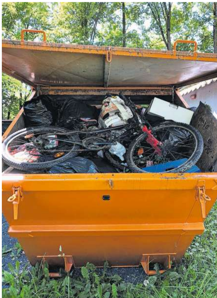
Die Zehn-Kubikmeter-Mulde war rasch voll.