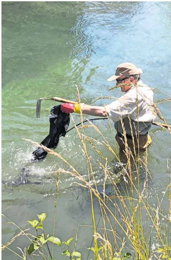
Die Helfenden waren ernüchtert über die Abfallmengen.