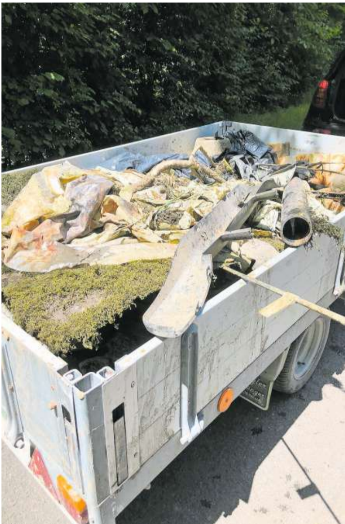
Siloballenplastik und viel weiterer Unrat.

Bis zum Mittagessen im Fischerheim war die Zehn-Kubikmeter-Mulde schon übervoll. Allen fleissigen Helferinnen und Helfern wurde gedankt, ebenso der Gemeinde Sevelen für den Beitrag an den wohlverdienten Znüni. (pd)